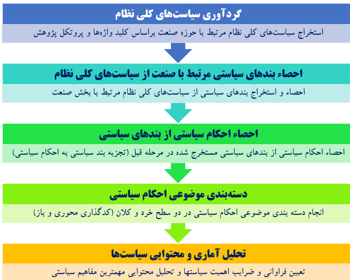
شکل ۱. مراحل اجرایی انجام پژوهش

در این بخش ضمن مراجعه به اسناد بالادستی کشور و پایگاه‌های اطلاعاتی مختلف، با در نظر گرفتن کلید واژه‌های پژوهش و همچنین با اعمال پروتکل پژوهش؛ ۱۹ بسته سیاستی مرتبط با صنعت (به صورت مستقیم و غیرمستقیم)؛ از جمله سیاست‌های کلی نظام در بخش صنعت (مصوب ۱۳۸۴/۰۵/۲۲ - ابلاغی ۱۳۹۱/۰۹/۲۹) و سایر سیاست‌های کلی نظام که هنوز پویا و فعال است مثل سیاست‌های کلی علم و فناوری، سیاست‌های تولید ملی، حمایت از کار و سرمایه ایرانی (ابلاغی ۱۳۹۱/۱۱/۲۴)، سیاست‌های کلی اقتصاد مقاومتی، سیاست‌های کلی اصلاح الگوی مصرف، سیاست‌های کلی تشویق سرمایه‌گذاری، سیاست‌های کلی برنامه‌ی ششم توسعه (ابلاغی ۱۳۹۴/۰۴/۰۹)، سیاست‌های کلی «خودکفایی دفاعی و امنیتی» (۱۳۹۱/۰۹/۲۹)، سیاست‌های کلی نظام در زمینه‌ی «انرژی» (۱۳۷۹/۱۲/۲۰)، سیاست‌های کلی اشتغال، سیاست‌های کلی اصل ۴۴ (۱۳۸۴/۰۳/۰۱)، سیاست‌های کلی اصل ۴۴