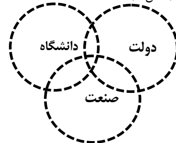
شکل ۳) مدل ماریپیچ سه‌گانه روابط دانشگاه - صنعت - دولت

نهایتاً در مدل ماریپیچ سه‌گانه به عنوان مدل ۳، زیرساخت‌های دانش‌محور بر مبنای حوزه‌های نهادی بهم مرتبط ایجاد شده و هر یک از این حوزه‌های نهادی به ایفای نقش یکدیگر پرداخته و «سازمان‌های پیوندی ۱ » با فصول مشترک متعدد پا به عرصه ظهور می‌گذارند (شکل ۳).